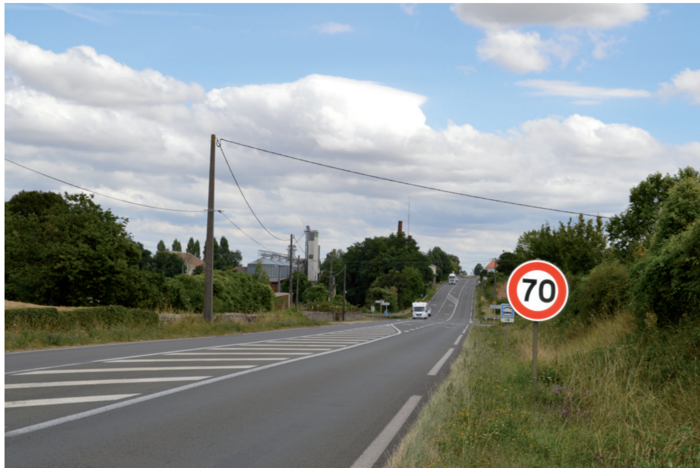
Photographie 2 : Linéarité des axes de circulation (ici la D948)

Les axes de circulation suivent en partie ces vallées, et traversent également les plateaux en lignes droites et rayonnent à travers tout le territoire. L'A10 coupe l'AEE au nord-ouest tandis que la voie rapide N10 le fait à l'est.